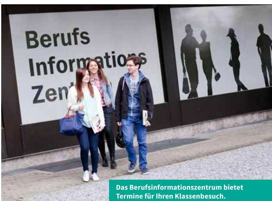
Das Berufsinformationszentrum bietet Termine für Ihren Klassenbesuch.

https://berufsfeld-info.de » Berufswelt Ausbildung