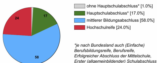
Ausbildungsanfänger/innen 2023 (in %)

Rechtlich ist keine bestimmte Schulbildung vorgeschrieben. In der Praxis stellen Betriebe überwiegend Auszubildende mit mittlerem Bildungsabschluss ein.