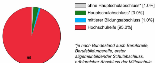
Ausbildungsanfänger/innen 2020 (in %)

Rechtlich ist keine bestimmte Schulbildung vorgeschrieben. In der Praxis stellen Betriebe überwiegend Auszubildende mit Hochschulreife ein.