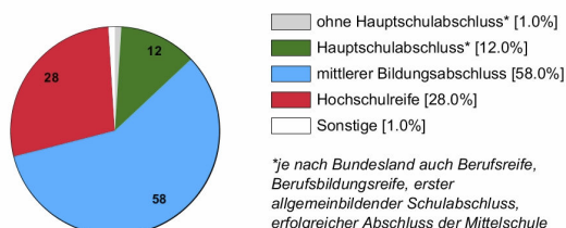
Ausbildungsanfänger/innen 2018 (in %)

Rechtlich ist keine bestimmte Schulbildung vorgeschrieben. In der Praxis stellen Betriebe überwiegend Auszubildende mit mittlerem Bildungsabschluss ein.