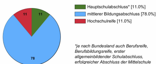
Ausbildungsbereich öffentlicher Dienst