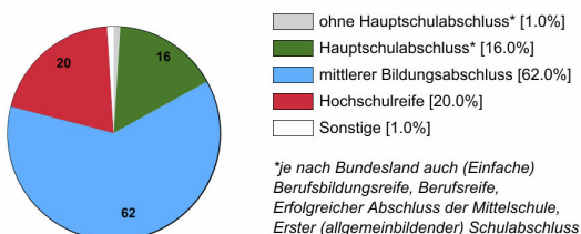
Ausbildungsbereich öffentlicher Dienst