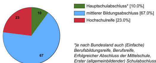
Ausbildungsbereich Industrie und Handel