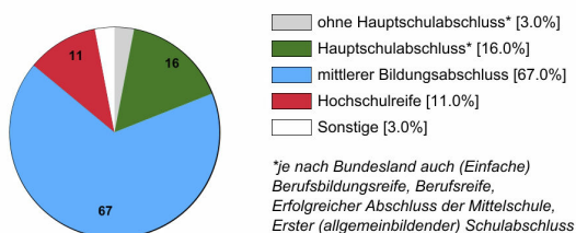
Ausbildungsbereich öffentlicher Dienst