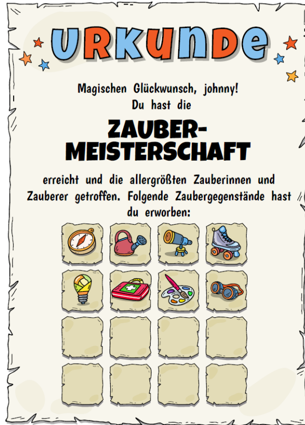
Beispiel einer Urkunde

Es wurden 8 Zaubergegenstände gesammelt. Der Spieler hat also Beiträge aus den abgebildeten Berufsfeldern angesehen und bewertet.