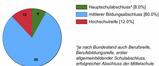
Ausbildungsbereich öffentlicher Dienst